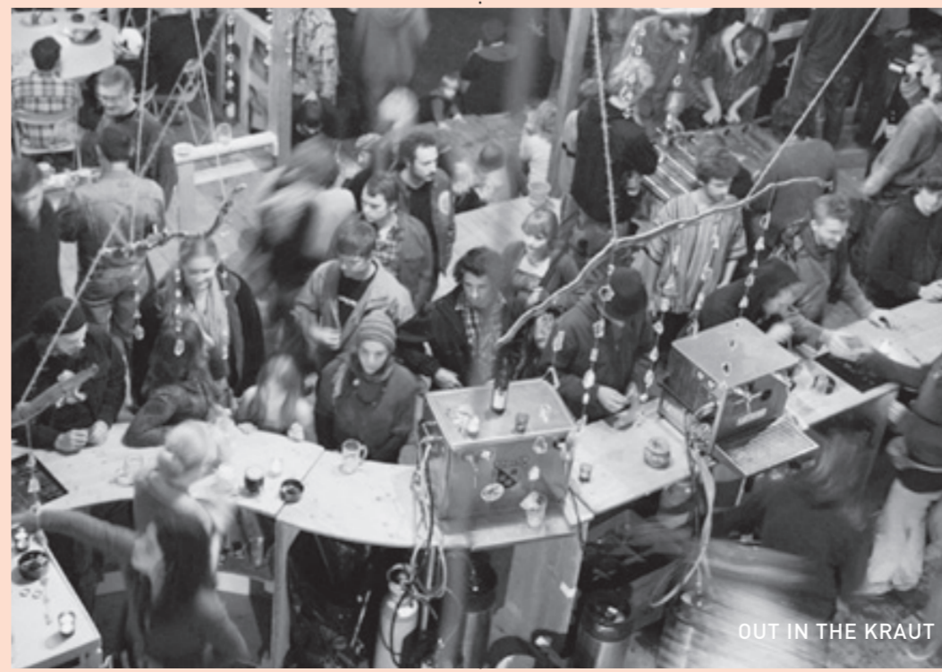
OUT IN THE KRAUT

Highlights: The Weightlifters, Uristier, Electric Hellesence Location: Wiese am Waldrand Special: Shuttlebus zum Bahnhof Kerzers und Campingplatz