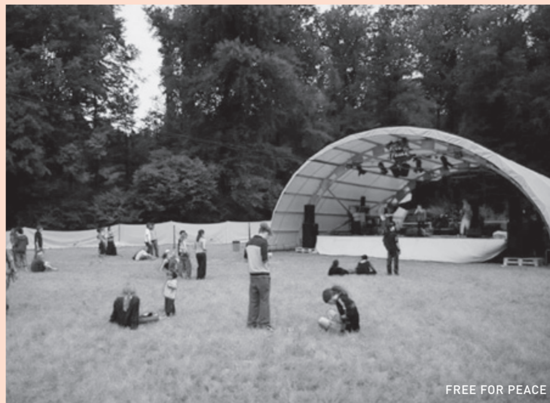
FREE FOR PEACE

16./17. JULI FREE FOR PEACE RINIKEN AG www.freeforpeace.ch Highlights: New York Ska Jazz Ensemble, Stahlberger, Aloan